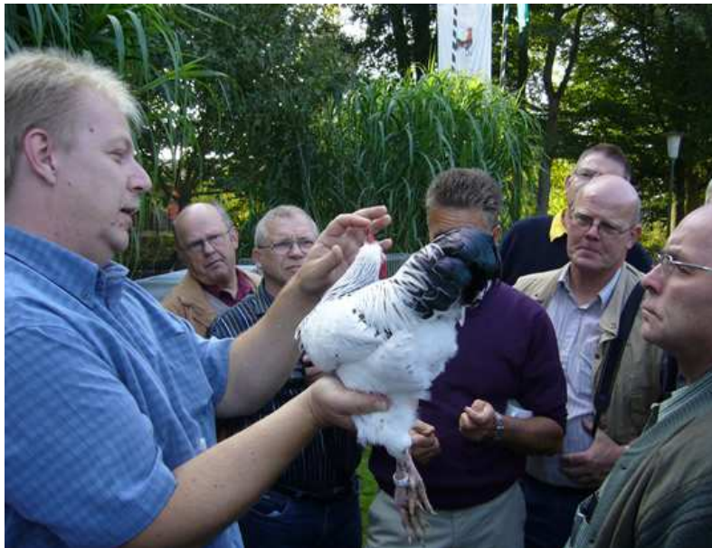
Die Besprechung am Tier ist besonders wichtig.

Bei allen nötigen „Verwaltungsakten“ dürfen wir nie vergessen, dass Sondervereine ihre grundlegende Aufgabe darin haben, bestimmte Rassen zu erhalten und sie dem Standard näher zu bringen. Damit haben der Zuchtwart und die Sonderrichter mit die Hauptaufgaben. Zum einen müssen sie regelmäßig Frage und Antwort stehen, zum anderen sind sie nach Rücksprache und im Dialog mit den Züchtern verantwortlich, den Weg in die Zukunft zu weisen.