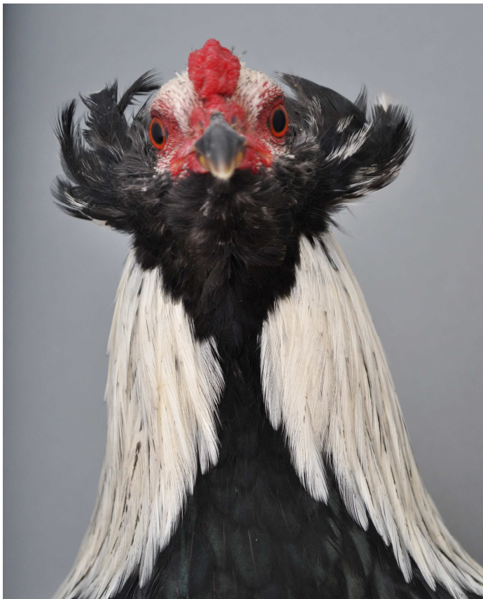
Zwerg-Araucana silberhalsig VZV Schau Ulm 2012