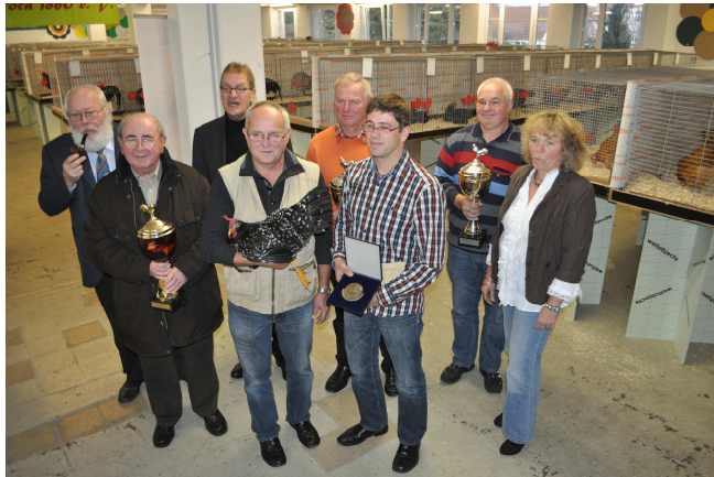
Sonderschauen der Höhepunkt des Jahres

statt, so muss eine kleine Rede verfasst werden und eventuell ist auch an ein Geschenk der Ehrengäste zu denken. Der Kassierer muss entsprechendes Preisgeld anweisen, damit dieses auch vergeben werden kann.