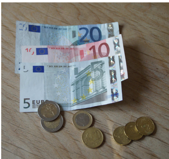
Die Vereinsfinanzen gehören in zuverlässige Hände. Bilden sie doch die Grundlage zu einer entsprechenden Vereinsführung.

Sondervereine besitzen kein Vereinsheim oder gar eine Gemeinschaftszuchanlage. Aus diesen Gründen können die entsprechenden finanziellen Rücklagen deutlich knapper bemessen sein. Eine gewissenhafte Finanzplanung, am besten schon mit dem Blick auf die nächsten Jahre gerichtet, ist deshalb mehr als anzuraten. Grundlage dazu ist ein Kassierer, der in der Lage ist, solche Abläufe zu strukturieren und aufzustellen. Kann man bei der Hauptversammlung die Finanzen deutlich machen, also zum Beispiel mit einem Tageslichtprojektor an die Wand werfen, dann ist auch für die nötige Offenheit gesorgt.